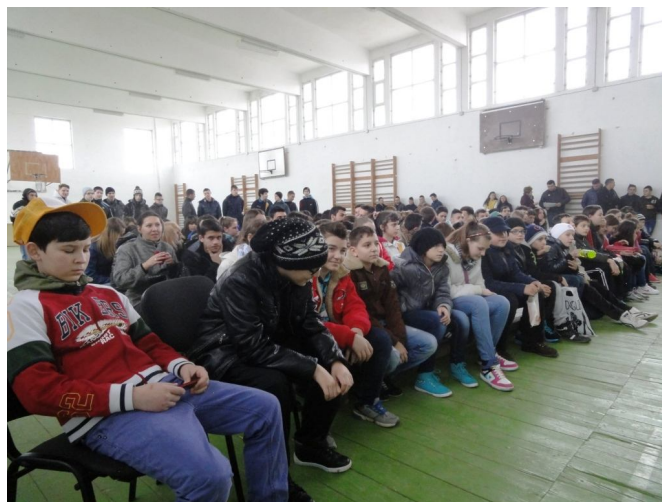
3 aprilie 2013 - Să știi mai multe, să fii mai bun....la Moldova Nouă.

În continuare a avut loc un concurs privind cunoștințele individuale, despre parcurile naturale și naționale din sudul Banatului la care concurenții au fost selectați dintre elevii și profesorii participanți la cursul de agent ecologic voluntar, pe care GEC Nera l-a derulat în cadrul acestor licee în perioada decembrie 2012 - aprilie 2013. Participanților la concurs li s-au acordat diplome și premii.