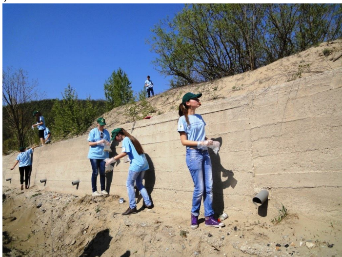
26 aprilie 2013 - monitorizarea haldei de deșeuri miniere de la Sasca Montană.

În perioada 26 - 27 aprilie GEC Nera, în parteneriat cu Administrația Parcului Național Cheile Nerei - Beușnița, a realizat prima etapă a programului MAREA HOINĂREALĂ 2013, care a inclus activități specifice în zona haldei de deșeuri miniere din Sasca Montană și pe traseele Valea Șușarei și Valea Beilului. La eveniment au participat și reprezentanți ai Administrației Pădurilor - Vojvodinașume și ai unor ONG-uri din Serbia.