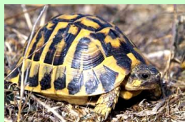
Țeestoasa lui Hermann. ( Testudo hermanni )