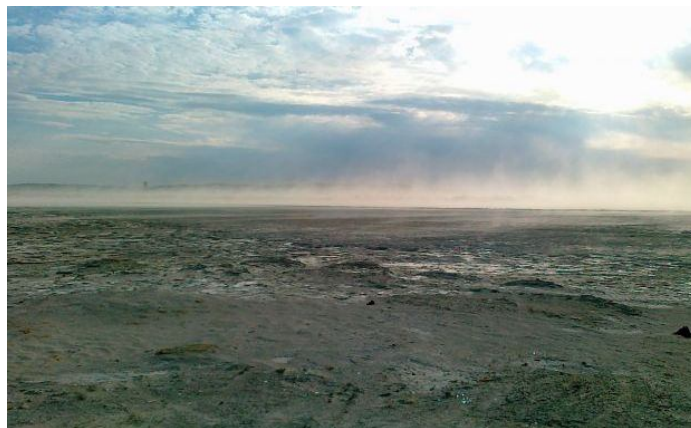
iazul de decantare Boșneag - extindere în perioade când se activează poluarea

În urma monitorizării de către GEC Nera a dezbaterilor din comisii și din plenul Parlamentului a proiectului Legii Bugetului de Stat pe 2013, rezultă că nici un parlamentar de Caraș - Sevein nu a depus amendamente la acest proiect de lege privind sumele necesare stopării poluării prin lucrări de consolidare vegetativă a iazului Tăușani - Boșneag deși, GEC Nera a pus la dispoziția parlamentarilor încă din 10 ianuarie a.c. documentația necesară pentru fundamentarea unor asemenea amendamente.